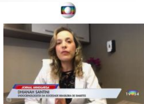
Jornal Vanguarda (TV Globo) 14/11/2020