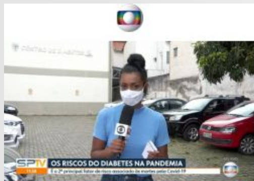
SPTV (TV Globo) 13/11/2020