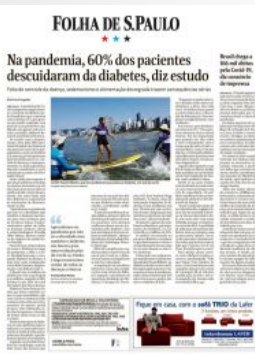
Folha de S. Paulo 17/11/2020